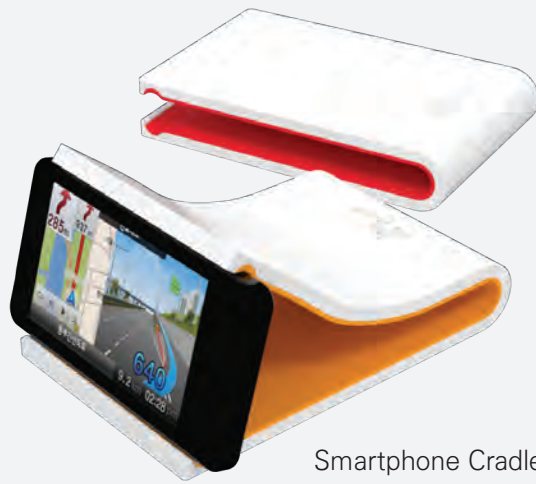
Smartphone Cradle, SK Planet