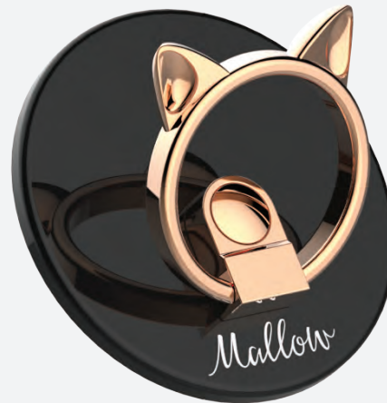
Smartphone Ring, CCC Frontier Japan