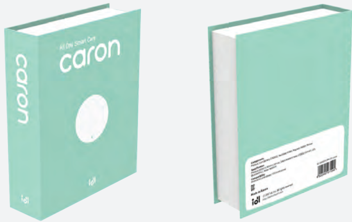
Package Design, iDL (Smart Tracker)