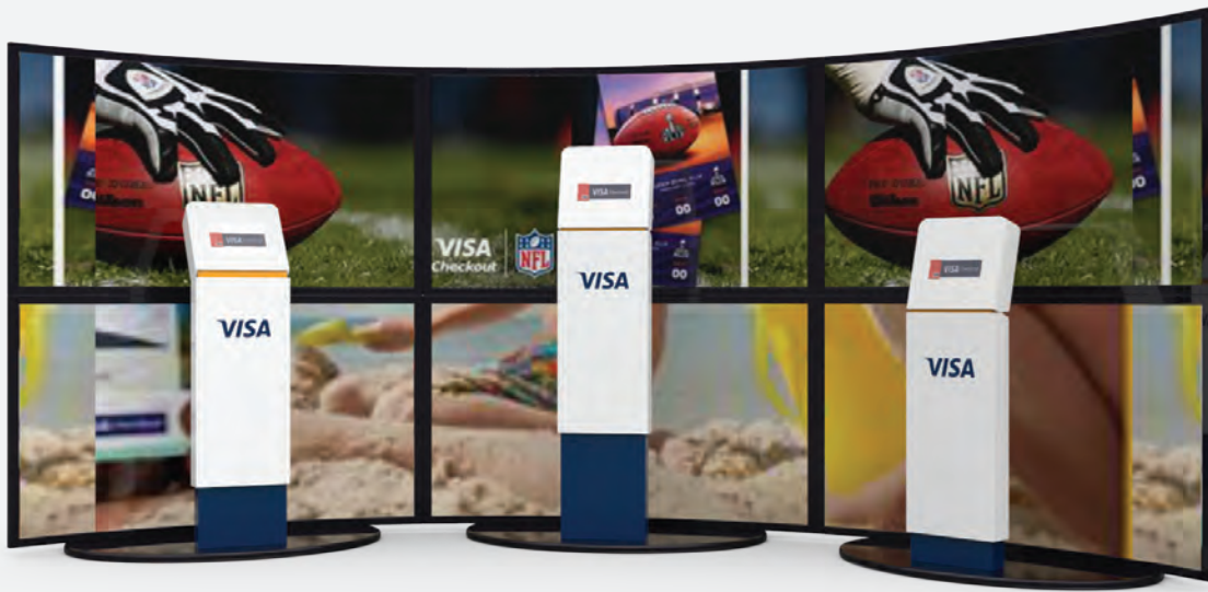
Kiosk, VISA Card US