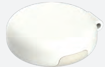
Smart Tracker, iDL

영디자인연구소는 실제 생산되어 사회에서 소비되기 위한 여러 분야의 제품군을 디자인해왔습니다. 그리고 이들은 100대 ~ 10,000대 이상씩 생산되어 소비자에게 전달되었습니다.