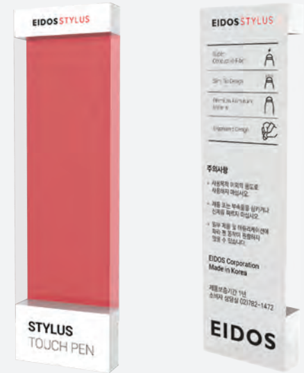
Package Design, EIDOS (Stylus Pen)